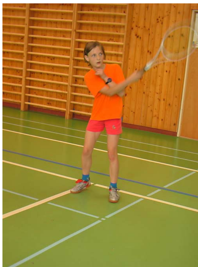
2006-22 A máš to tam přesně v rohu.