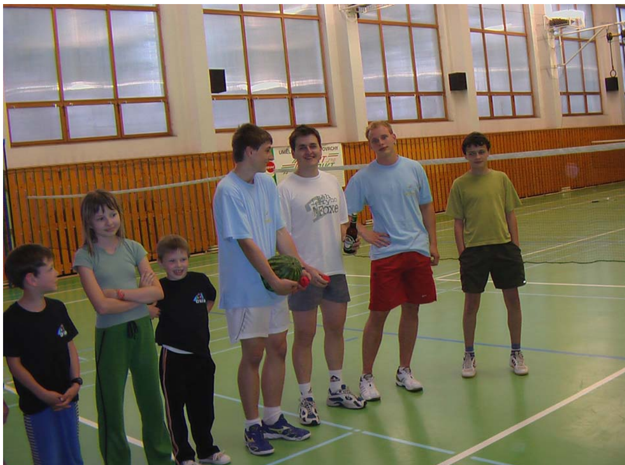
2006-60 Čtveřice odvážných, která šla do souboje s menšími a nebála se handicapů.