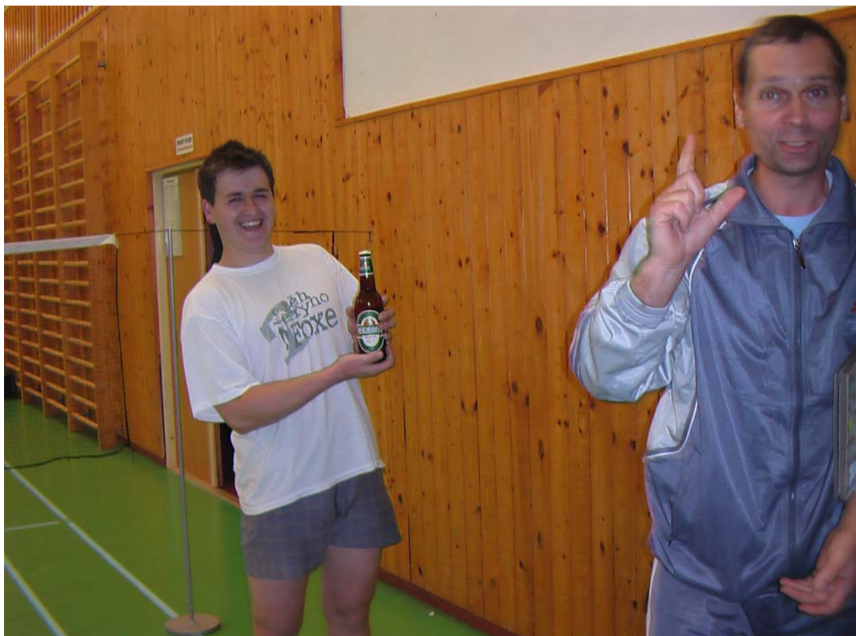
2006-58 I když jen na chuť a s regulovanou spotřebou.