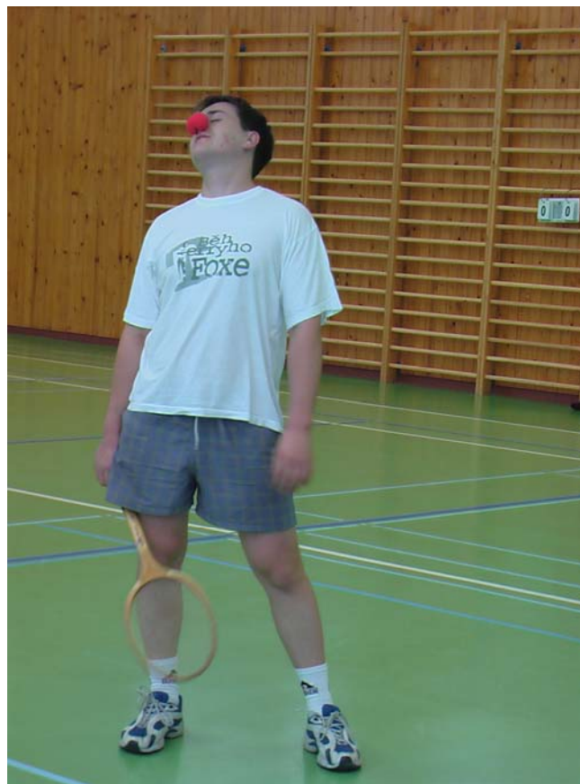
2006-34 Ježíš Maria Josef, zase vedle.