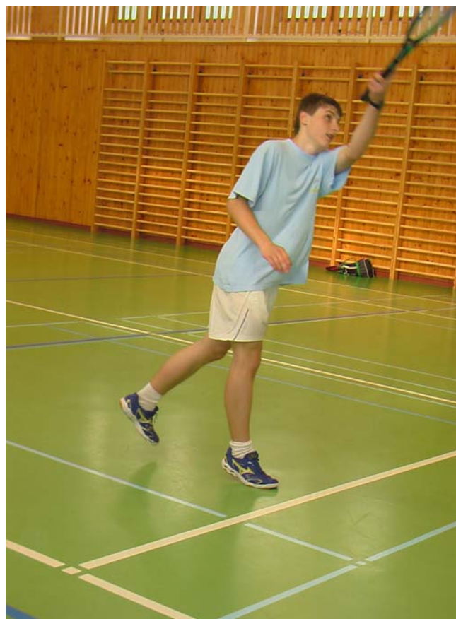
2006-30 Levačkou to chce s citem.