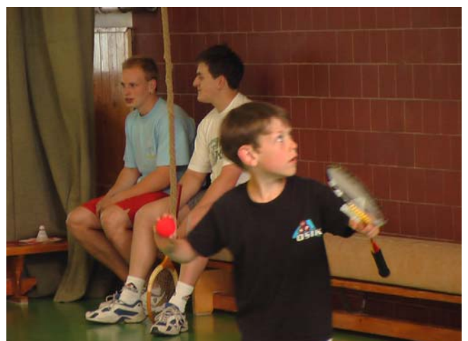
2006-42 Já se trefím i klaunským nosem.