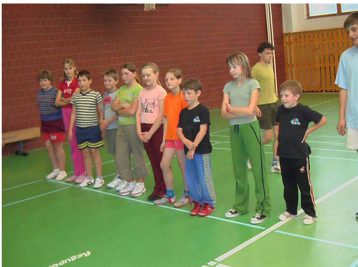
2006-56 Napínavé očekávání cen a vyhodnocení oddílového turnaje.