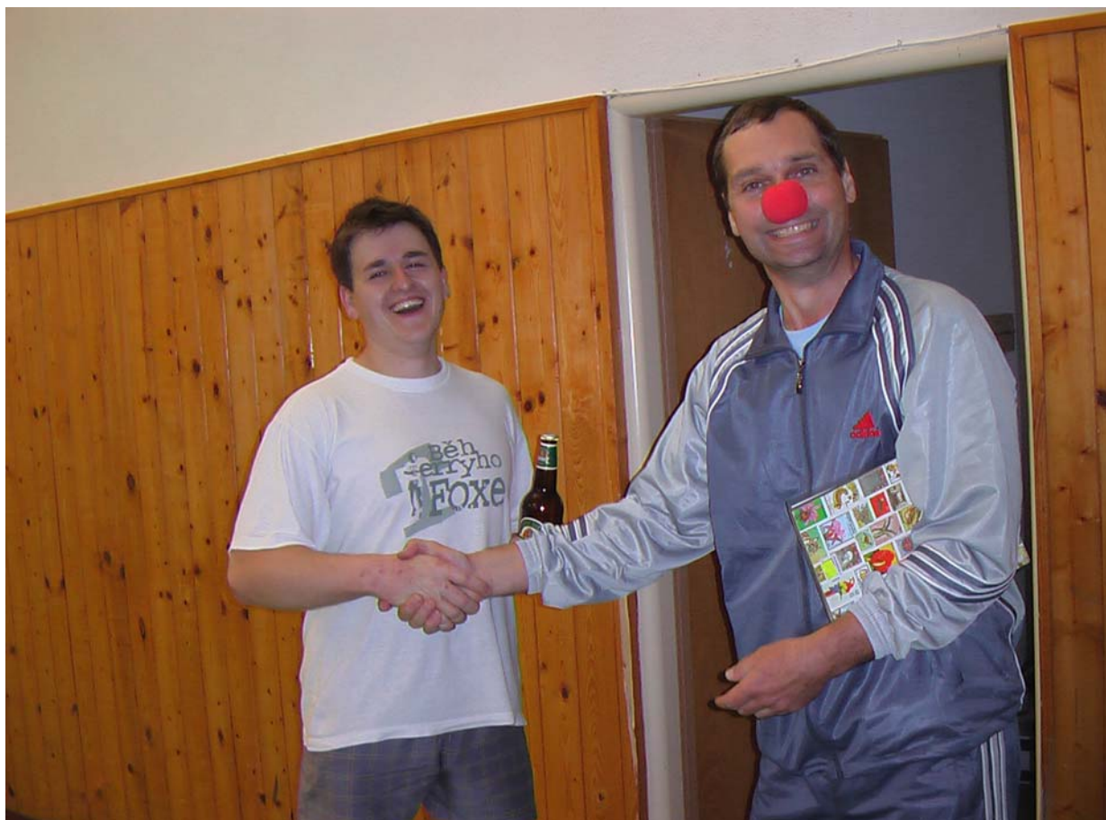
2006-57 I dospělí něco dostali, aby doplnili chybějící tekutiny.