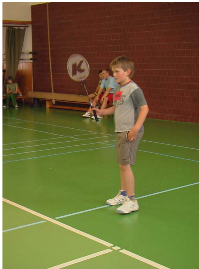
2006-24 Teď jsem na tebe vymyslel pěknou fintu.