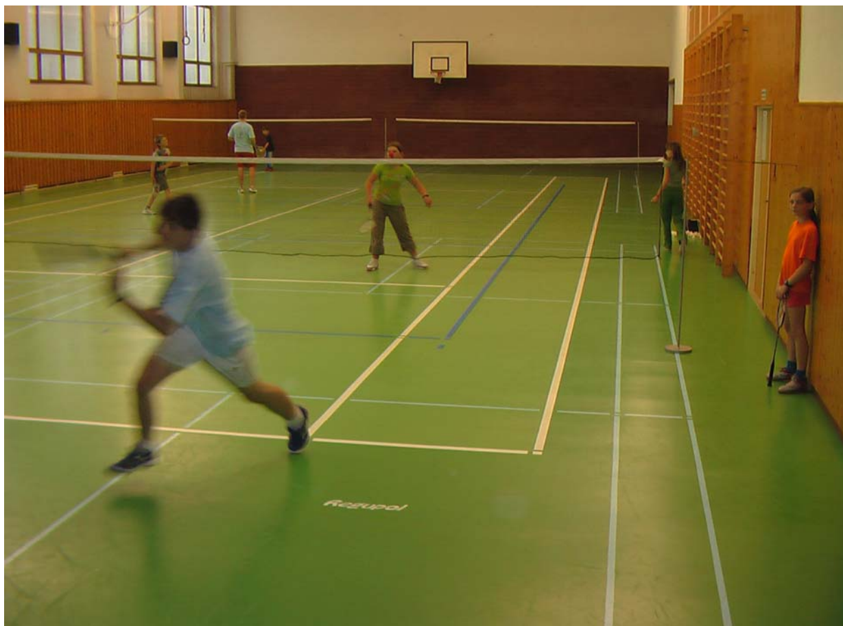
2006-46 Barča - Lukáši, běhej trošku rychleji, ať to stihneš.