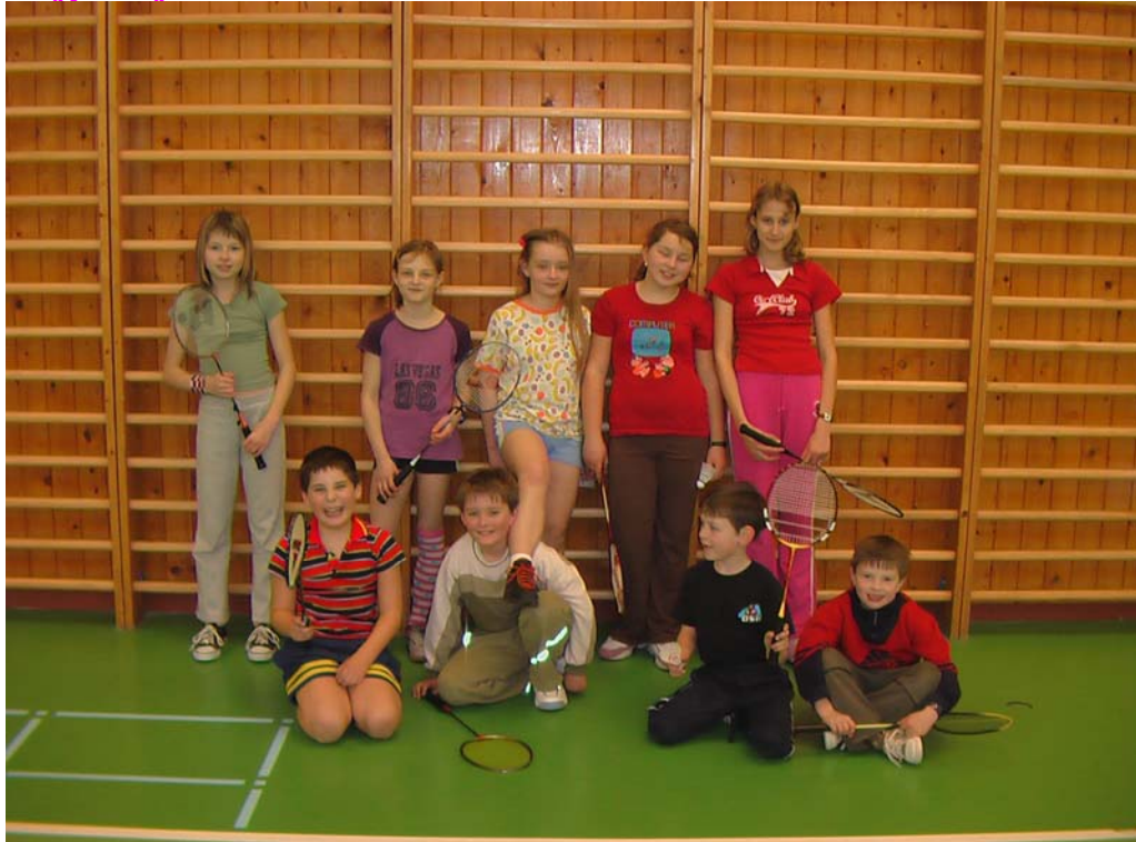
2006-15 Nejdříve ti menší.