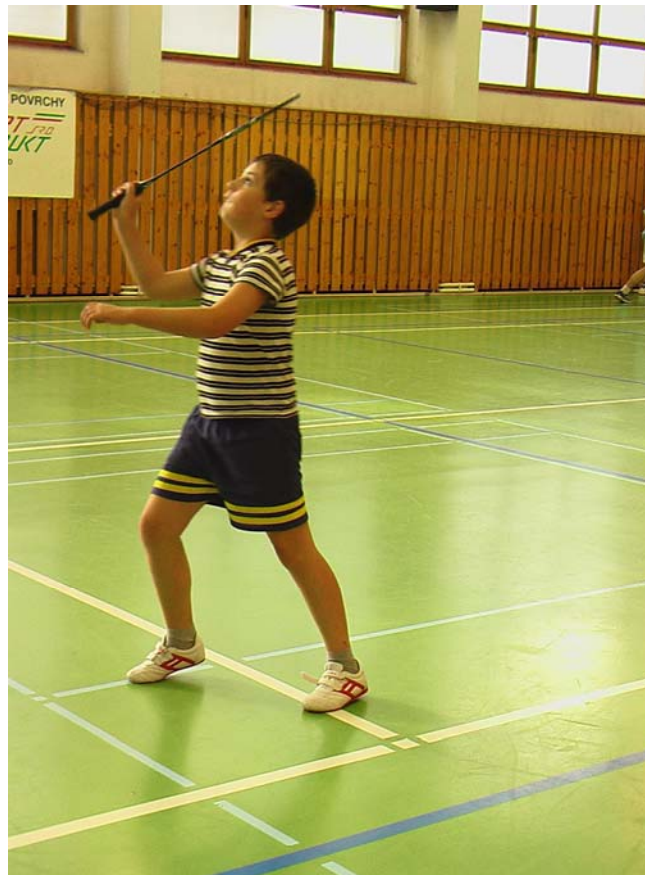
2006-26 Hele moucha. Já ji plácnu, jo.