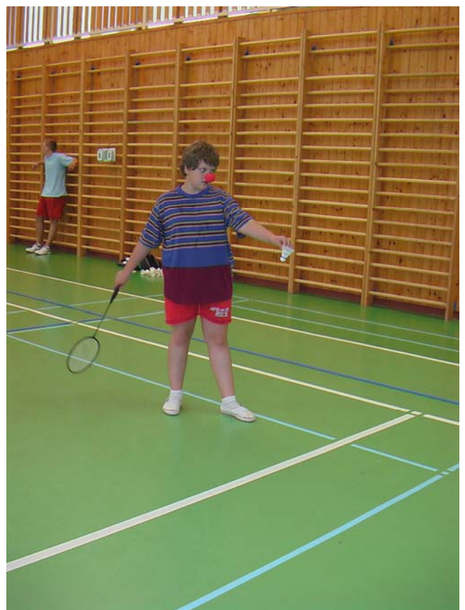
2006-40 Kam to mám, proboha, podávat.