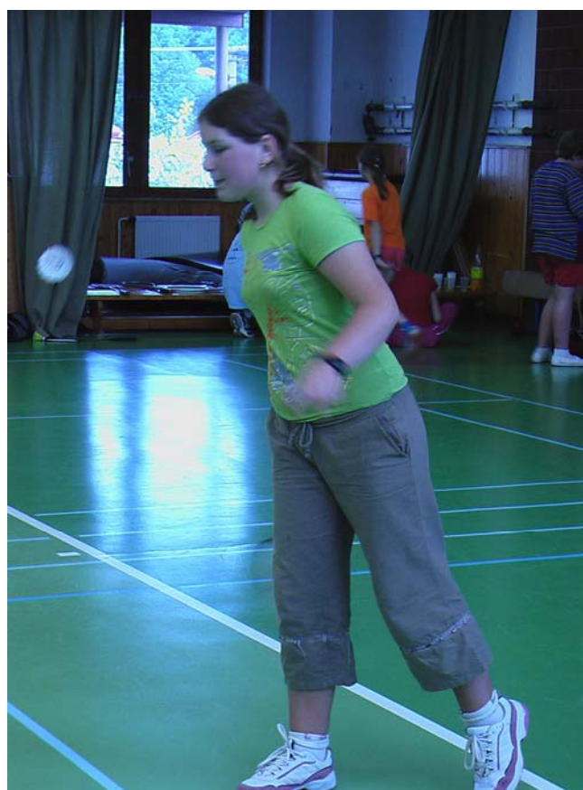
2006-28 Ale jen když se trefím.