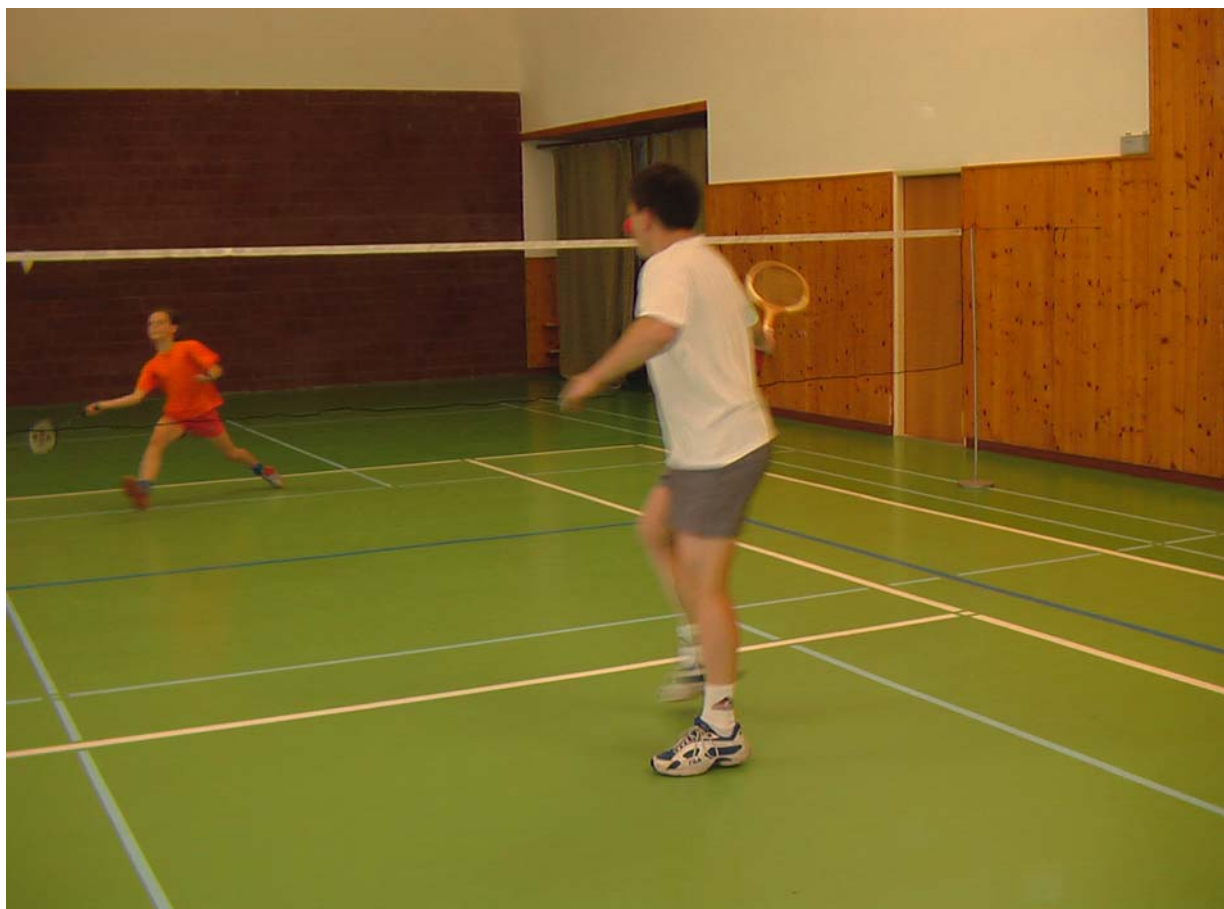
2006-54 O napínavé souboje nebyla nouze, zejména ti dospělí hrající s tenisovou raketou a opačnou rukou bývali před zápasem velmi rozechvělí.