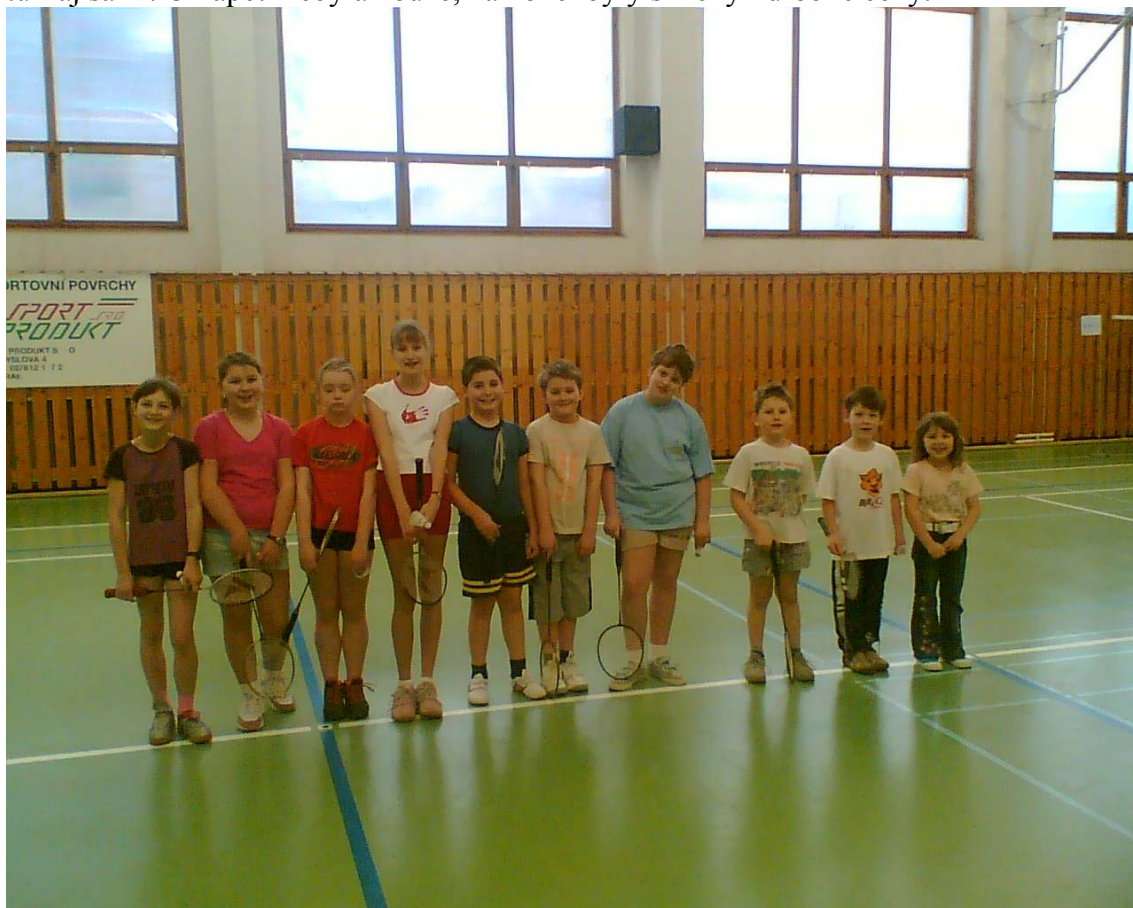
2006-8 Deset odvážlivců.

V kategorii do 11 let máme asi nejvíc dětí, bohužel nikdo další nepřišel a tak jsme si udělali turnaj sami. O napětí nebyla nouze, na konci byly slzičky i drobné ceny.