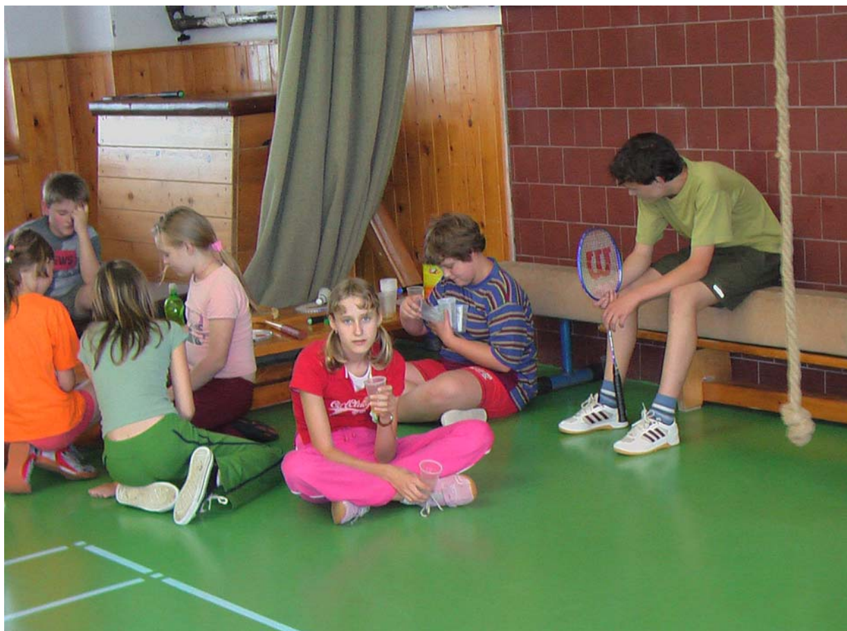
2006-53 Odpočinek mezi zápasy a plnění pitného režimu.