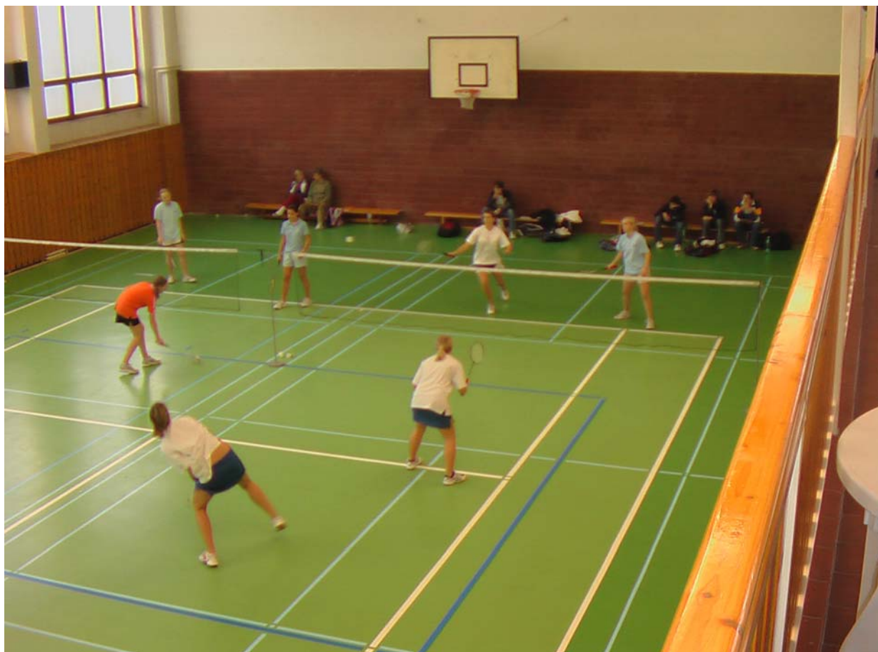
2006-7 Jsme rádi, že dívky nehrají společně s chlapci. To by byl mazec.