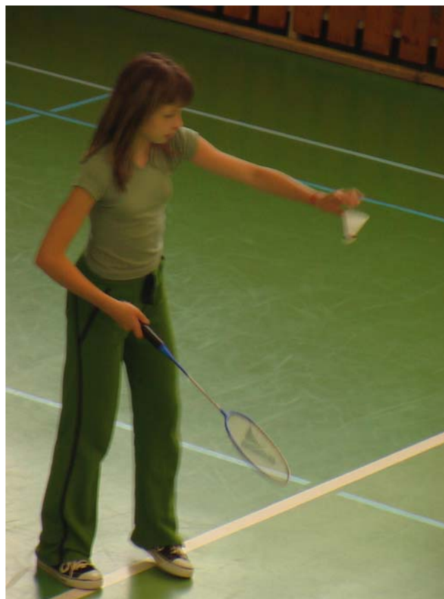
2006-32 A taky že jo.