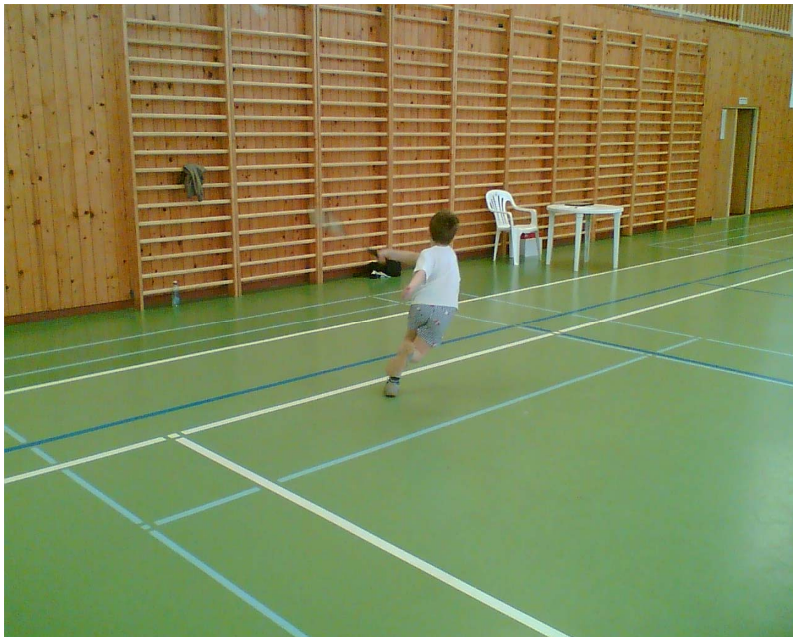
2006-10 Honzík Kladiva – Všechno uběhám, létám jak vítr.