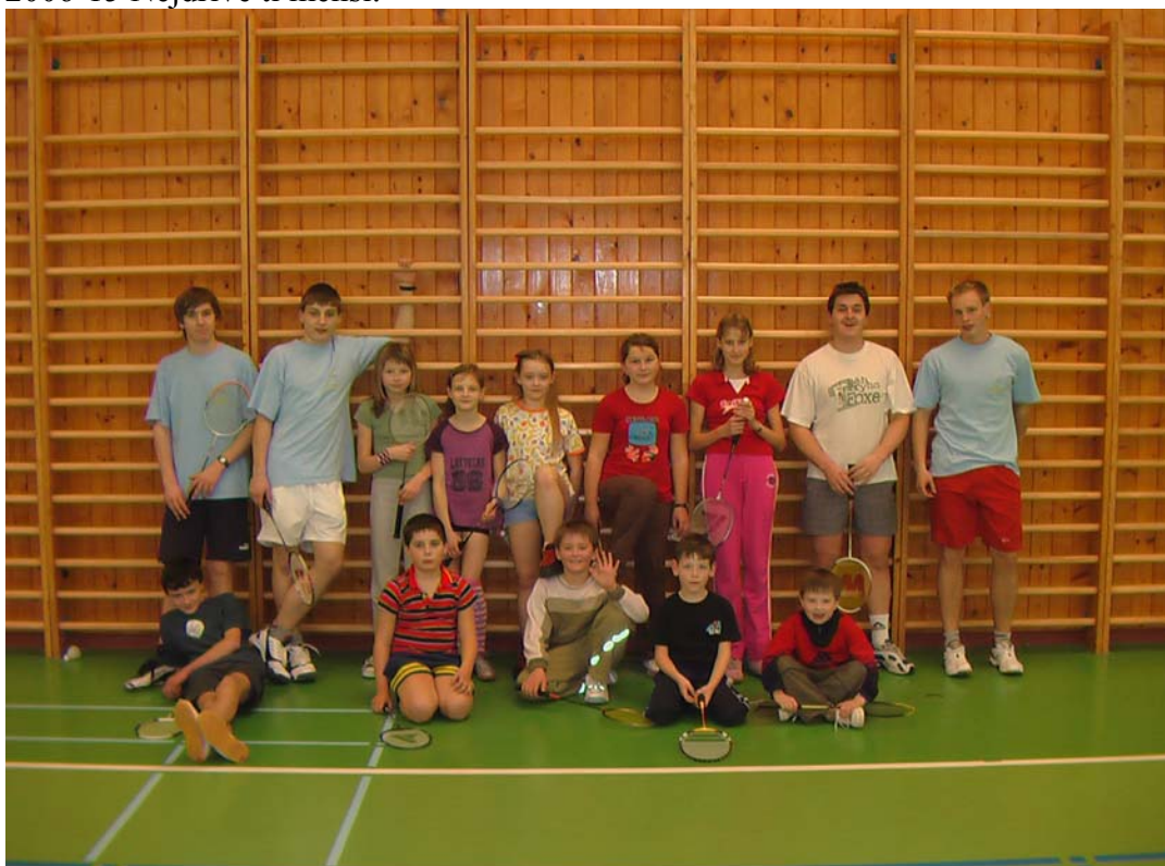
2006-16 A teď všichni nejpilnější.